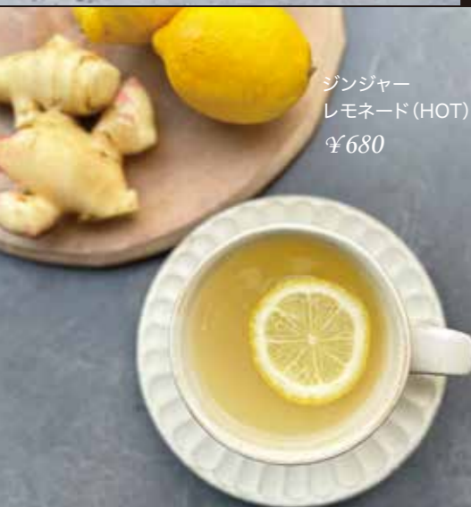
ジンジャー レモネード (HOT) ¥680