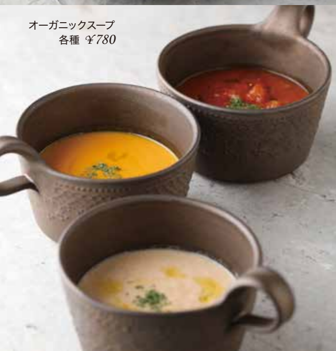
オーガニックスープ 各種 ¥780