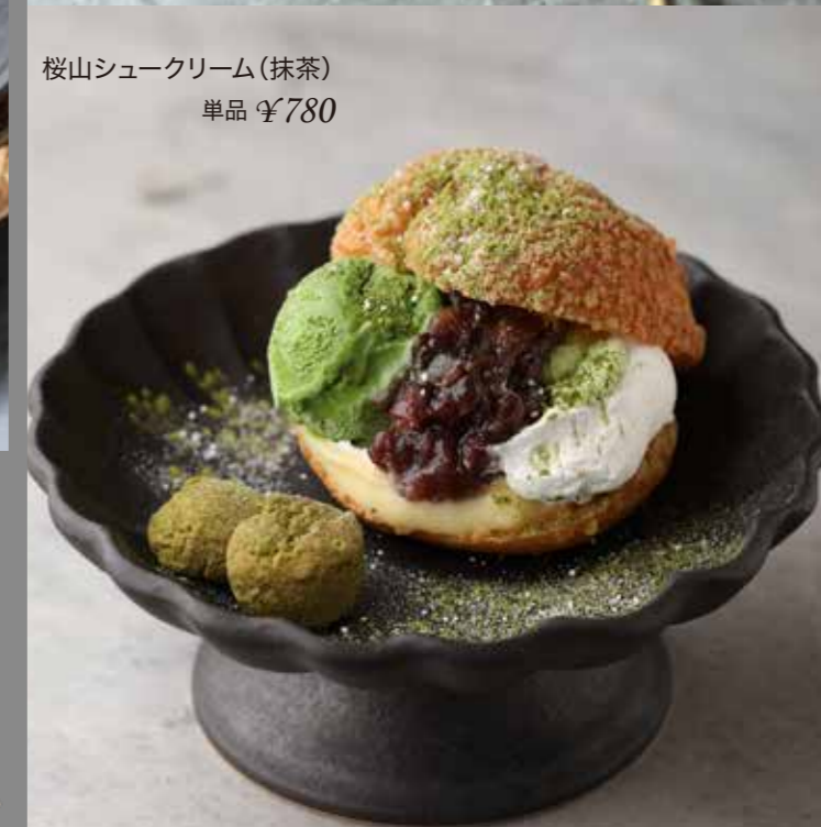
桜山シュークリーム(抹茶) 単品 ¥780