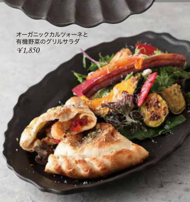
オーガニックカルツォーネと有機野菜のグリルサラダ ¥1,850