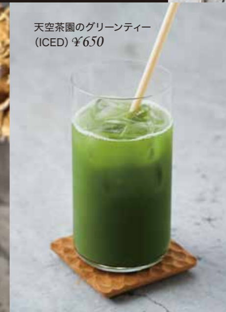
天空茶園のグリーンティー (ICED) ¥650