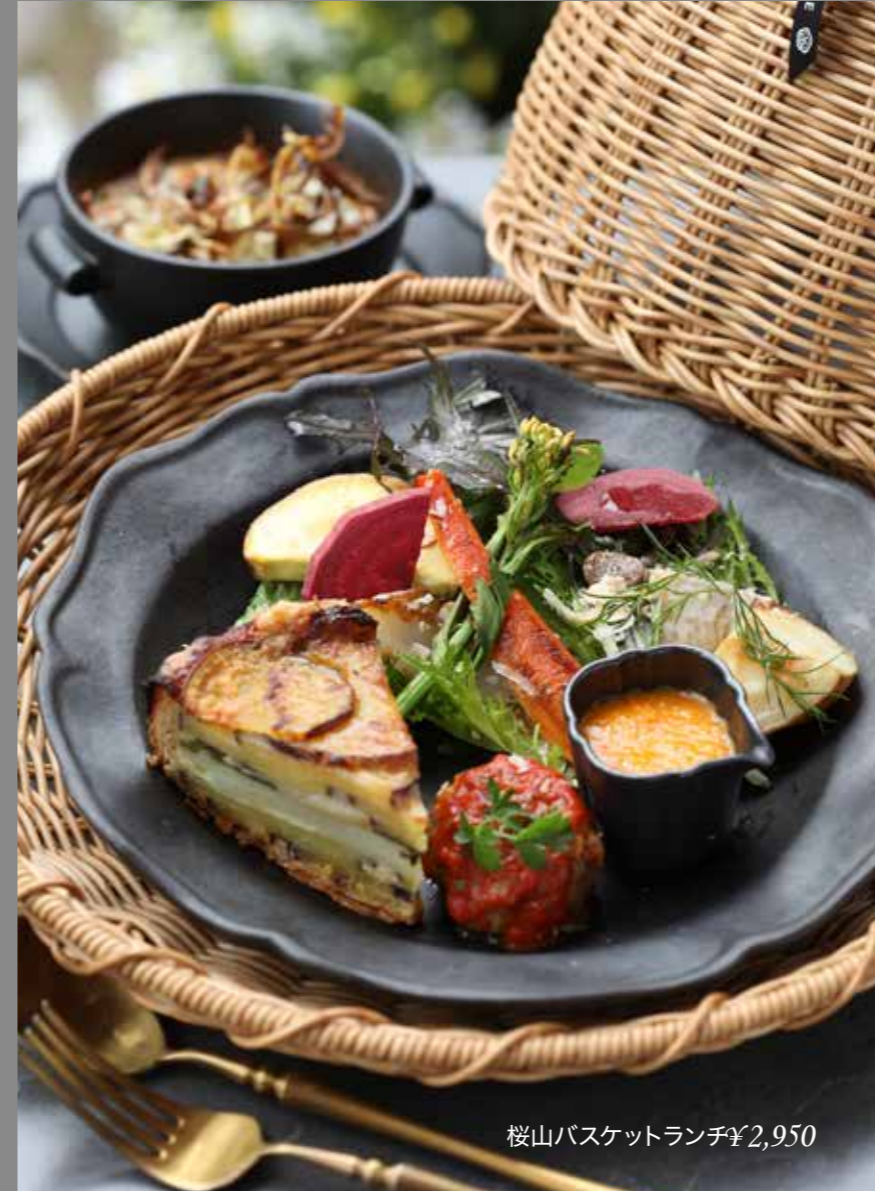
桜山バスケットランチ ¥2,950