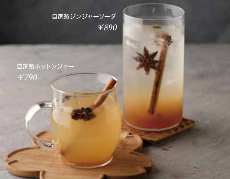
自家製ホットジンジャー ¥790