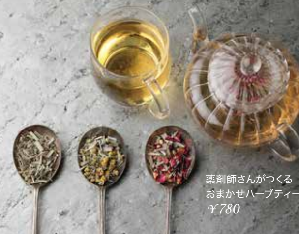
薬剤師さんがつくる おまかせハーブティー ¥780