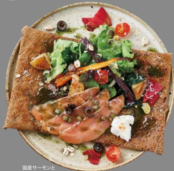
国産サーモンと有機野菜サラダのガレット ¥1,850