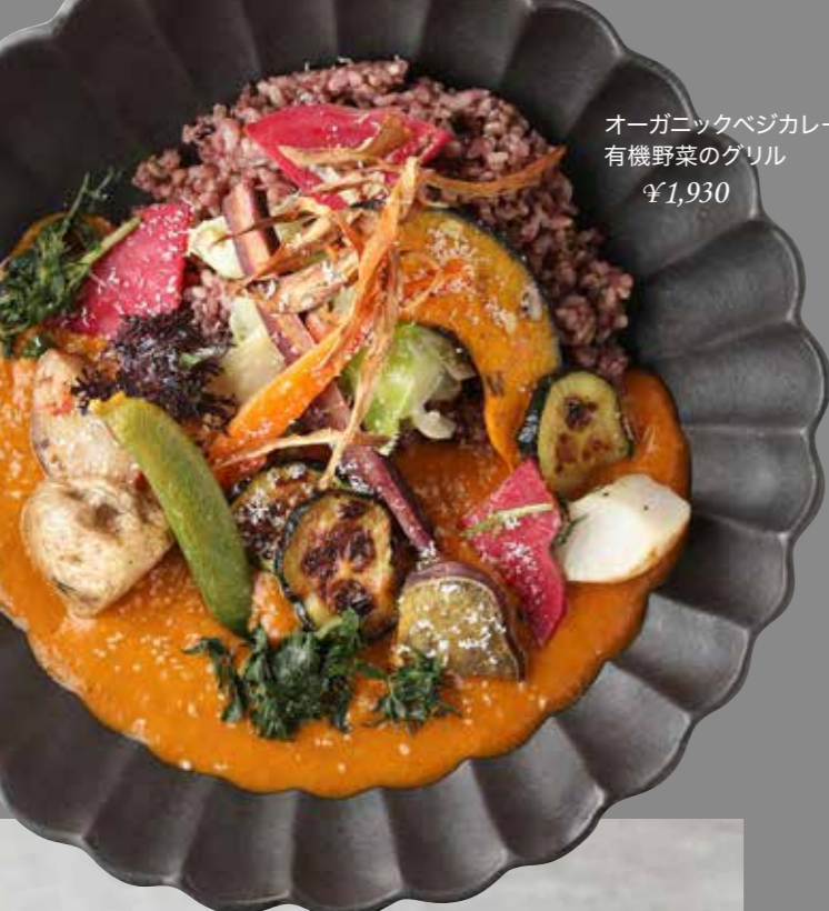
オーガニックベジカレーと有機野菜のグリル ¥1,930