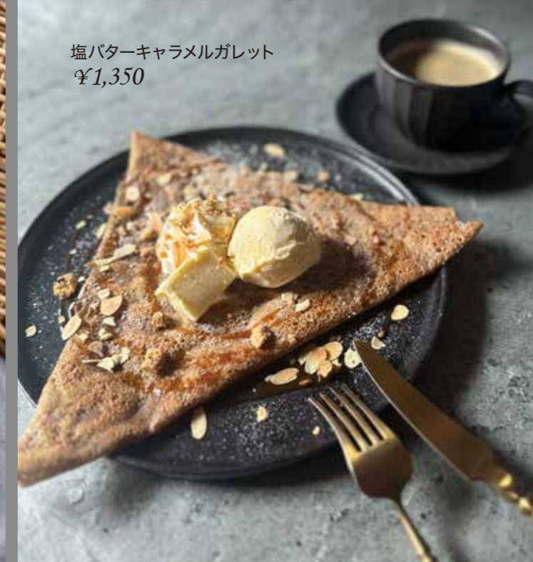
塩バターキャラメルガレット ¥1,350